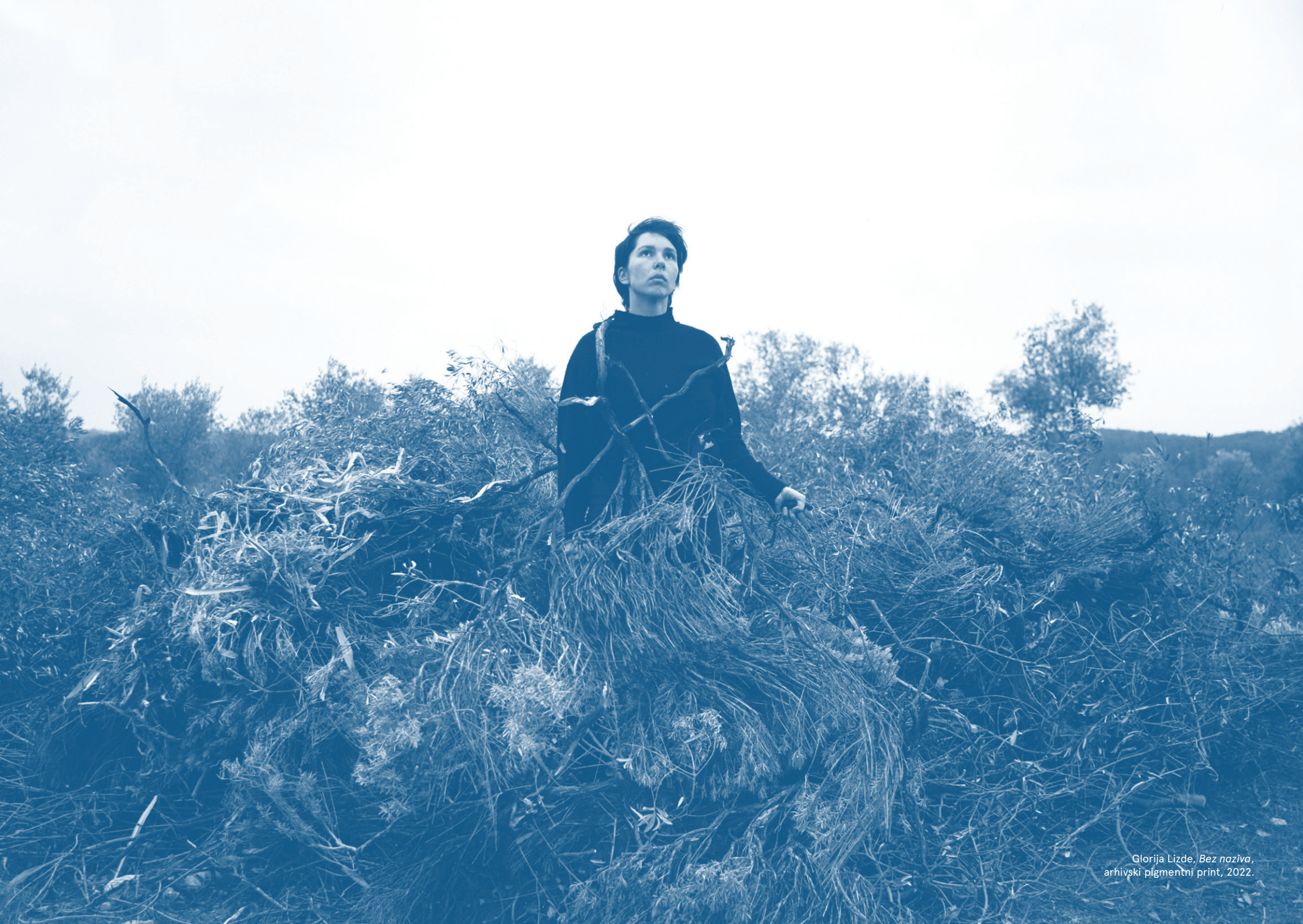
Glorija Lizde, Bez naziva , arhivski pigmentni print, 2022.