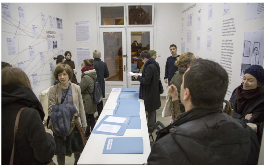
otvorenje izložbe: Problem umjetnosti kolektiva , slučaj: Zemlja