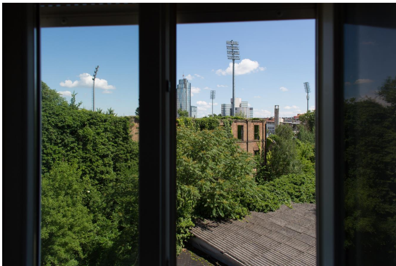
pogled na staru tvornicu svile, tura Adžijina 11: način upotrebe Božene Končić Badurina, foto: Damir Žižić

Dok čekamo da netko od financijera prepozna važnost ovog tipa podrške, fokusirali smo se na suradnje s aktivističkim udrugama i inicijativama kojima smo ustupali prostor za razne potrebe. Tako smo ustupili prostor udruzi Zagreb Pride koja je u BAZI organizirala izložbu u sklopu Tjedna ponosa, kao i udruzi Vox Feminae koja je organizirala tribinu o ženskom radu. U BAZI je održano i više aktivističkih radnih sastanaka, a za održavanje redovitih sastanaka prostor je ustupljen i Udruženju za medijsku demokraciju.